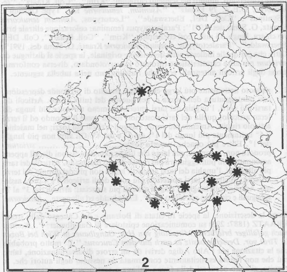
Fig. 2: Asemum tenuicorne Kraatz. Diffusione attualmente nota.

La distribuzione attualmente nota è riassunta nella Fig. 2, in cui compare anche il primo reperto italiano, oggetto della presente nota.