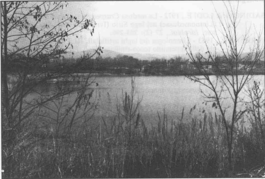
Fig. 1 - Laghetto nel greto del fiume Foglia in località Schieti (Pesaro).