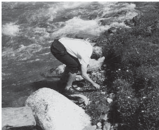
A caccia d'insetti sulle rive di un torrente.

Nel 1944 gli fu concesso un viaggio di studio, seguito da un breve corso all'Accademia d'Arte di Dresda; successivamente si impegnò a fondo nello studio della medicina. Quest'ultima tenace applicazione, nei poliedrici studi che caratterizzano la Sua vita, gli permise nel giugno del 1946 un posto di lavoro presso il Museo Zoologico di Monaco di Baviera (Zoologische Staatssammlung, München), all'inizio come aiutante scientifico, poi in attesa di un posto di assistente. L'inserimento in questo museo avvenne grazie alla sensibilità dell'allora direttore, il quale capì, al di là della difficile situazione fisica dell'ex-soldato Heinz Freude, che aveva a che fare con un naturalista dalle potenzialità non comuni.