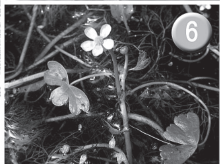
1 Frutto di Cistus incanus 2 Bupleurum baldense 3 Carlina vulgaris 4 Limodorum abortivum 5 Plantago cornuti 6 Ranunculus aquatilis