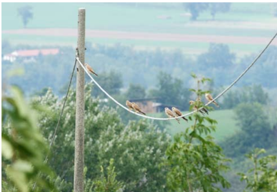
Fig. 3 – Gruppo di grillai, femmine e giovani (Palazzo Boffondi 26/8/05).

Non sono stati raccolti elementi sufficienti per valutare la sex-ratio degli adulti, a