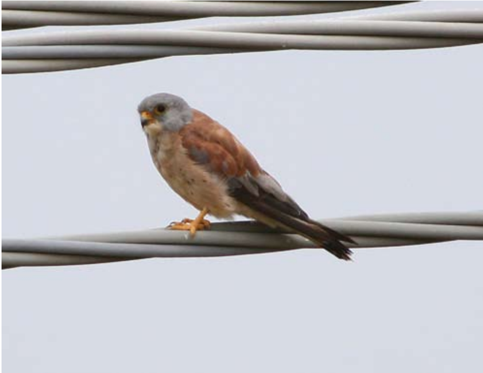
Fig.2 – Grillaio, maschio (Palazzo Boffondi 26/8/05).

tivo nell'Italia meridionale (MASSA, 1992; MASCARA & SARÀ, 2006).