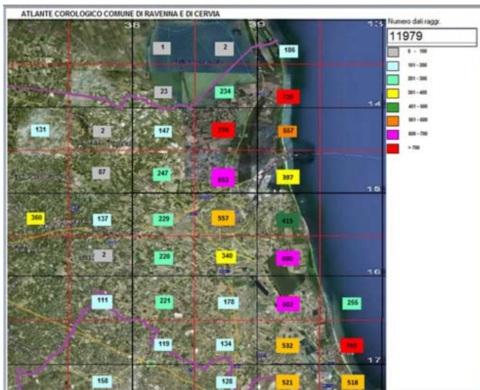
Fig. 1 - Stato dell'arte Atlante Corologico Comuni di Ravenna e Cervia (bozza al 25-02-2016 – solo il 40% dei quadranti sono stati censiti in modo adeguato)

Le uscite in tutti i quadranti CFCE del Comune di Ravenna stanno continuando, per contribuire all'Atlante corologico della costa ravennate, mentre il sogno di un Atlante dell'intera Romagna comincia a prendere forma, ma per questo occorre un impegno comune di molti ricercatori: speriamo che il futuro ci veda in tanti al lavoro.