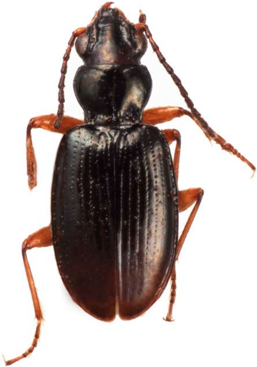
Fig. 1. Habitus di Bembidion (Omoperypus) hypocrita normandi De Monte, 1947: typus, 3.50 mm (NHMW).