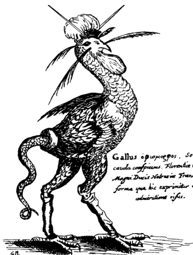
Gallus ophiocrotopus, Serpentina cauda conspicua. Florentia in horto Magis Ducis Medicei Francisci ea forma qua hic exprimitur omnium edularum estis.